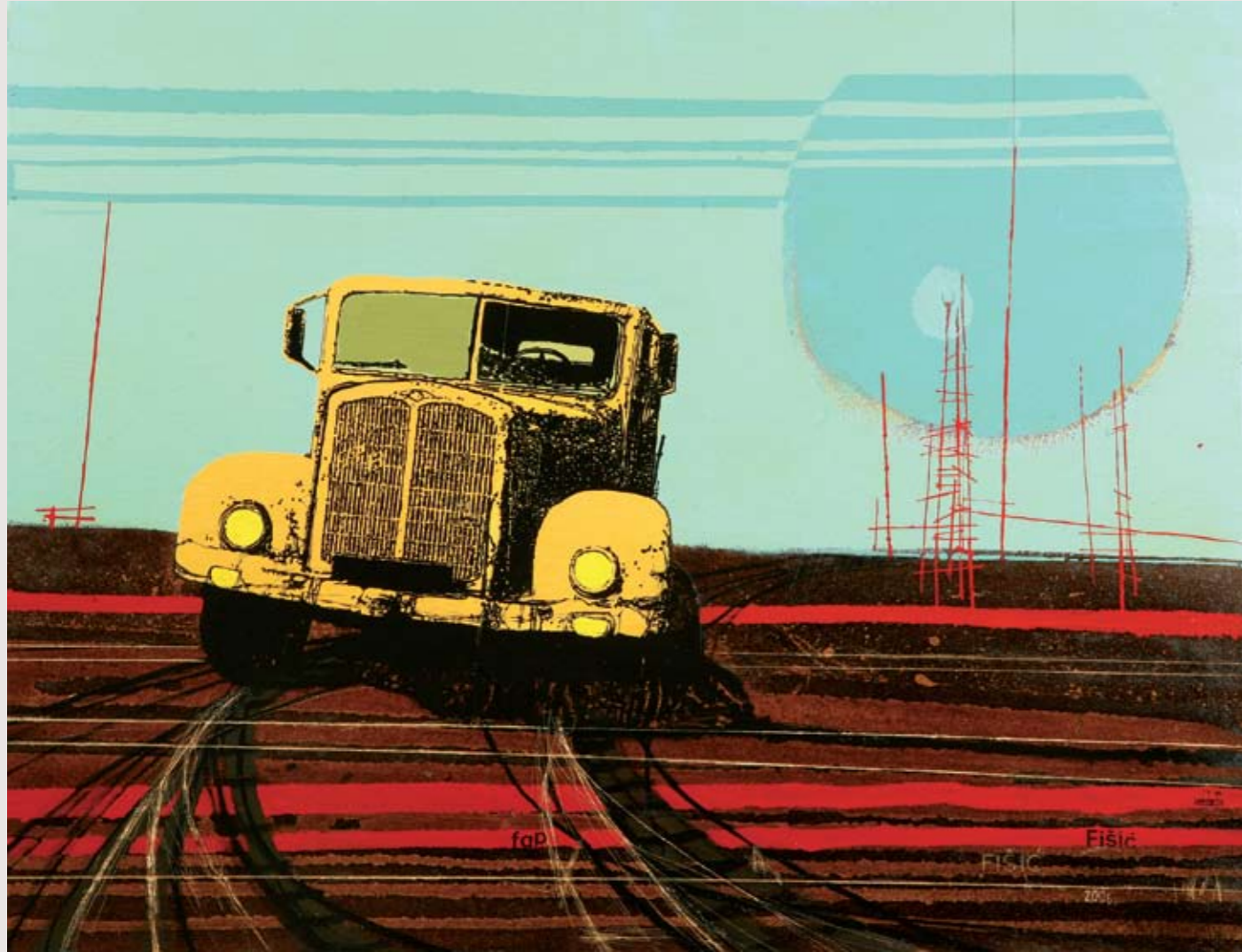
Rust Never Sleeps 1