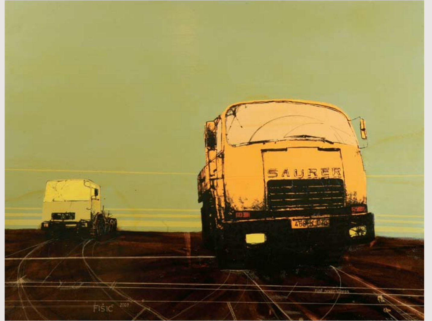
Rust Never Sleeps 3